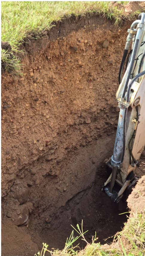
Foto 5.1. Horisontaalkihiline kruus kaevandis K-8

Uuringuruumi kasulik kiht on esindatud horisontaalkihilise veeriselise kruusa ja eriteralise liivaga, mille täiteks on erineva savikusega peeneteraline liiv (Foto 5.1; 5.2). Kruusaterad on valdavalt suurusega 2 - 7 cm, keskmiselt kulutatud, nii kristalliinse kui karbonaatse koostisega. Esineb üksikuid munakaid läbimõõduga kuni ~70 cm. Kruusas ja liivas veeriseid (fr > 64 mm) keskmiselt ~15% ja jämefraktsiooni (fr > 2 mm) sisaldus on keskmiselt 40%. Kruus ja liiv on veidi savikas, savi- ja tolmuosakeste sisaldus ~5%. Kasuliku kihi paksus on kaevandite põhjal 0,9 - 4,7 m, keskmine 2,8 m. Üksikutes kaevandites (K-1/25, K-6/25, K-8/25, K-11/25), valdavalt reljeefi kõrgemates kohtades, kasuliku kihi lamamini ei jõutud. Kogu kruusakiht jääb põhjaveetasemest kõrgemale. Kasuliku kihi lõimise keskmisi näitajaid on iseloomustatud maavara kvaliteedi peatükis.