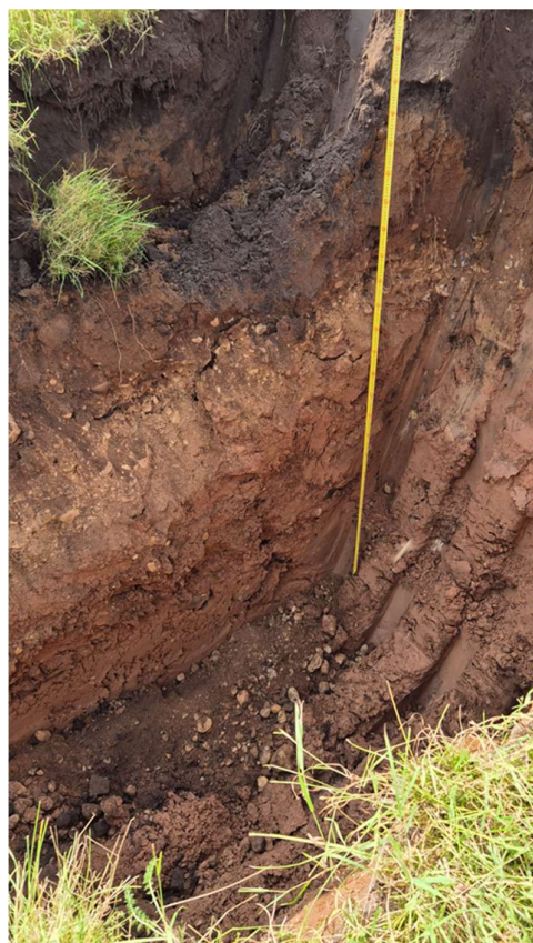
Foto 5.4. Punakaspruun liivsavimoreen kaevandis K-12.

Kasuliku kihi lamamipind tõuseb loode suunas, jäädes uuringuruumis abs kõrguste vahemikku 80,2 - 86,3 m.