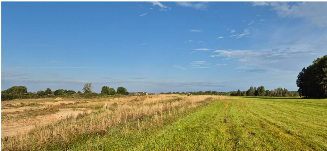
Foto 2.1. Vaade Murese IV uuringuruumi lõunapoolsele lahusosale K-1 läheduses