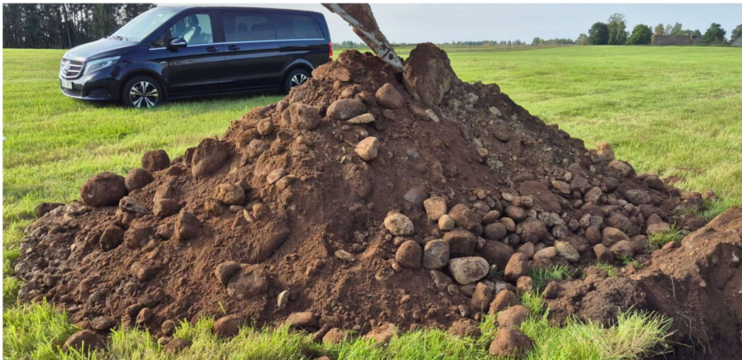
Foto 5.3. Veeriserohke munakatega kruus kaevandis K-5.

Kasuliku kihi lamami moodustab tihe punakaspruun liivsavimoreen, milles esineb üksikuid veeriseid (Foto 5.4).