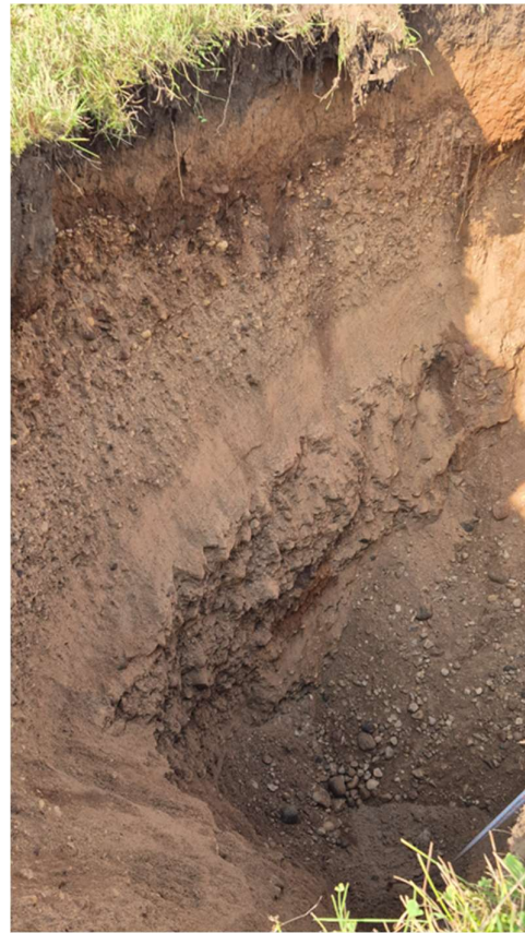
Foto 5.2. Liiva ja kruusa vaheldumine kaevandis K-9