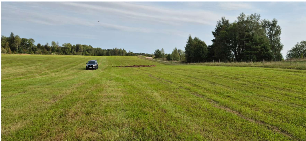
Foto 2.2. Vaade Murese IV uuringuruumi põhjapoolsele lahusosale K-10 läheduses.

Murese kruusamaardla pindala on 26,34 ha ja maavarade registri põhjal on seisuga 16.06.2025. a arvel ehituskruusa aktiivset tarbevaru 402,601 tuh m 3 , aktiivset reservvaru 254 tuh m 3 , passiivset tarbevaru 11 tuh m 3 ja prognoosvaru 1426 tuh m 3 ning ehitusliiva aktiivset tarbevaru 363.155 tuh m 3 .